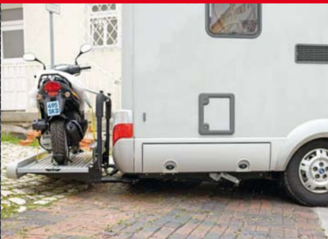
Heben: für kritische Situationen immer gut gerüstet