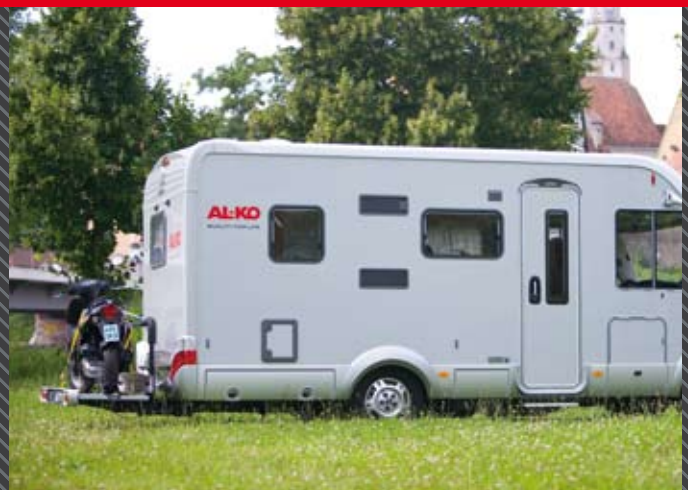
Auto-Level-Funktion: automatisches Nivellieren auf Knopfdruck am Stellplatz