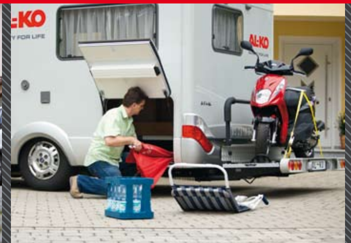
Senken: für komfortables Beladen