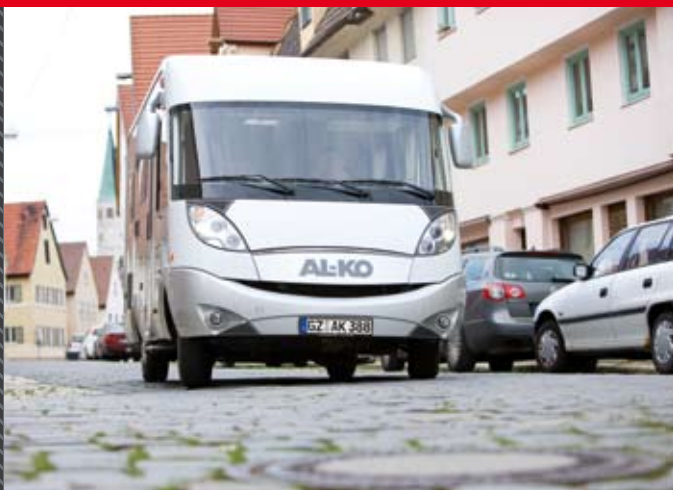
Mehr Federungskomfort auf allen Straßenbelägen